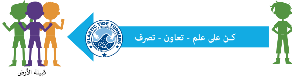
الكفاءات للتربية البيئية

تهدف الكشافة من خلال العمل على أهداف التنمية المستدامة إلى إلهام الشباب وتمكينهم؛ لجعلهم مواطنين عالميين نشطين من أجل مجتمعات مستدامة. حيث تطبق قبيلة الأرض هدف الكشافة من أجل التنمية المستدامة من منظور التربية البيئية على النحو التالي: